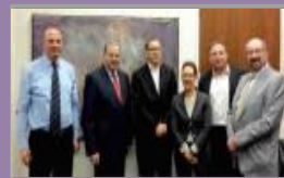
עמותת הידידים הקנדית של מאיר מגייסת כספים עבור בית החולים