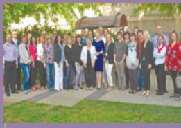
משלחת אונקולוגים מתארכת במאיר