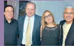
המועדון העסקי-חברתי של מאיר התכנס במסעדת "טבולה" הרצליה