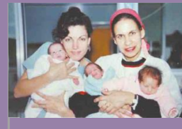
מוריה ליכט נולדה כפגה במאיר וילדה פג ביום הולדתה