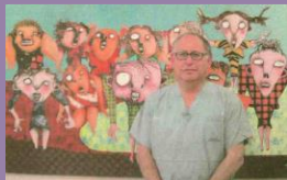
פרופ' אילן לייבוביץ מספר על הציורים יצירות האומנות שלו

הקליקו על כל תמונה/כתבה לצפייה בכתבות המלאות