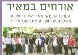
אורחים במאיר המרכז הרפואי מאיר אירח השבוע משלחת של 24 רופאים אונקולוגים מתארכת במאיר