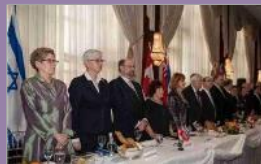
עמותת הידידים הקנדית של מאיר מגייסת כספים עבור בית החולים